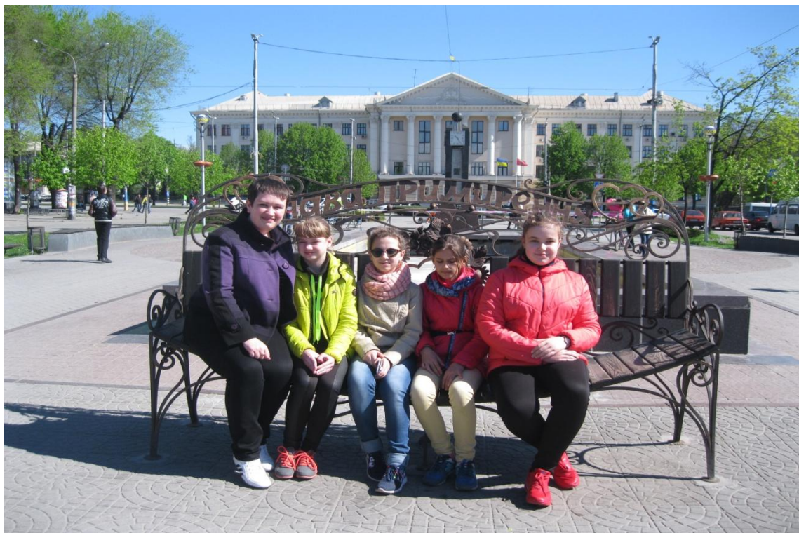
Мал. 10 Лавка примирення