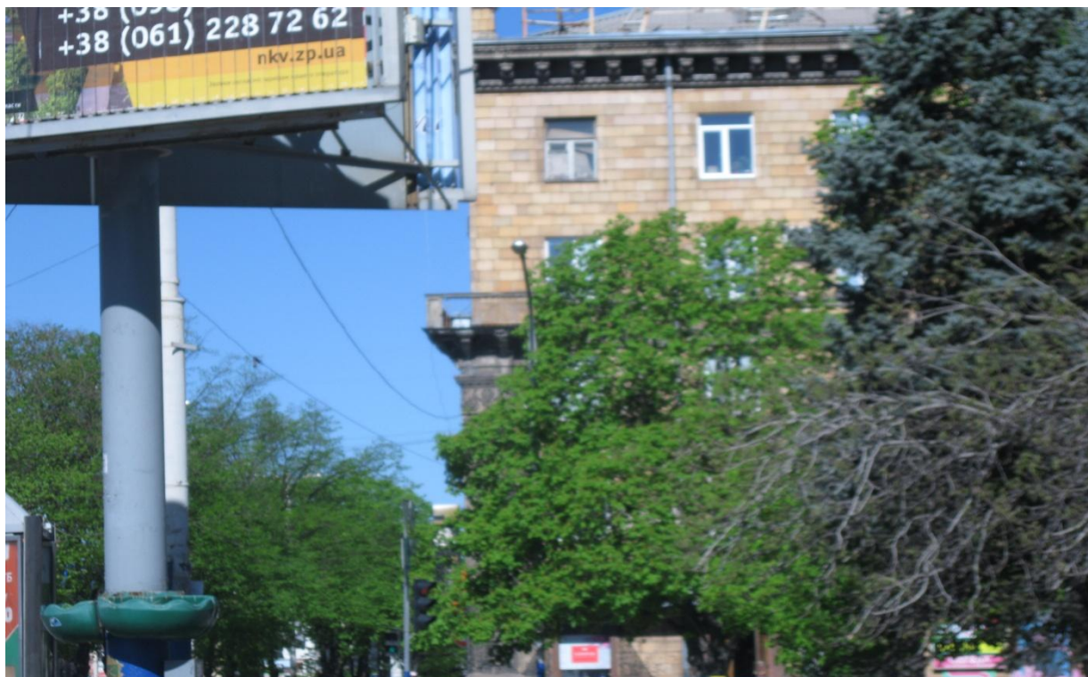
Мал. 9 Будинок, у якому проходили зйомки фільму «Весна на Зарічній вулиці»

Також ми побачили будинок, у якому проходили зйомки фільму «Весна на Зарічній вулиці» (мал. 9).