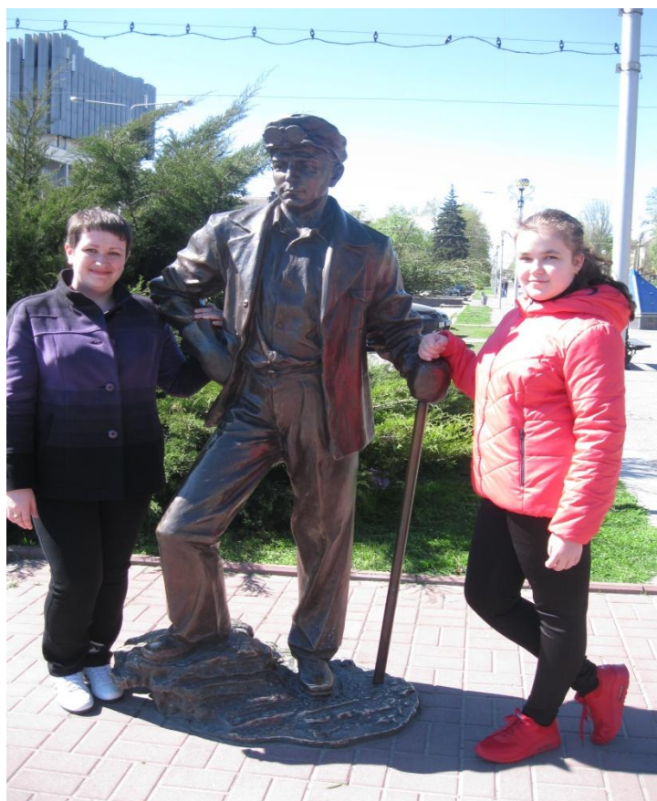
Мал.11 Скульптура герою фільму «Весна на Зарічній вулиці» сталевар