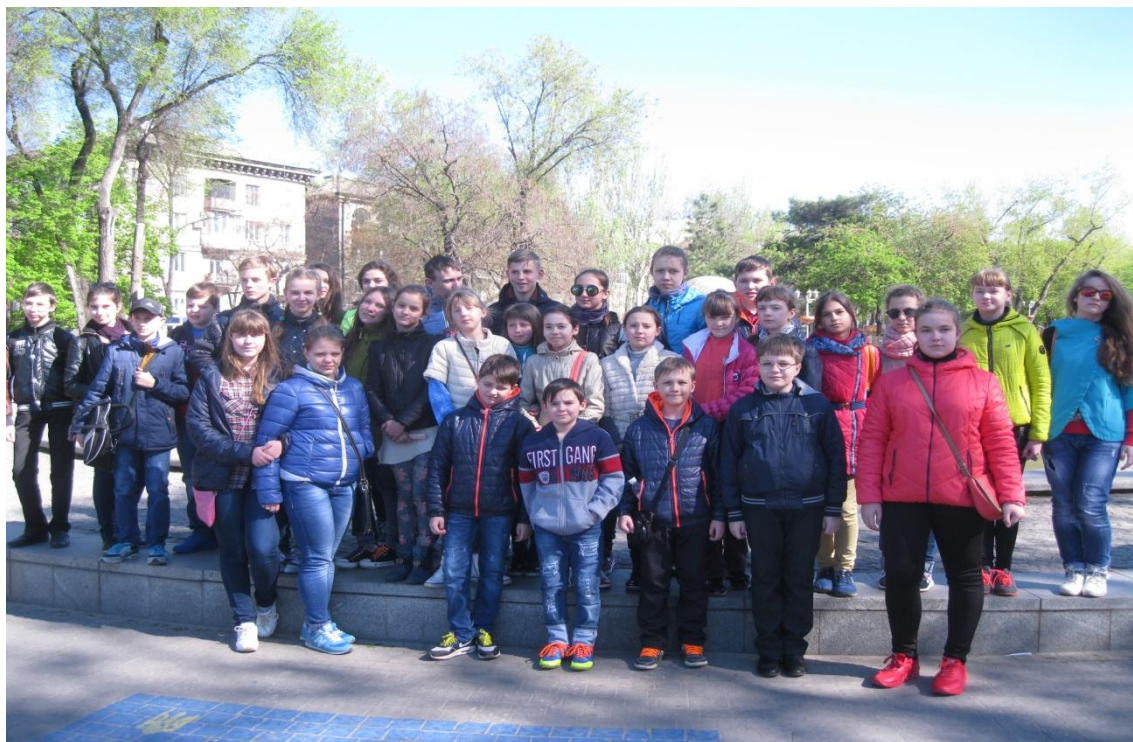
Мал. 1 Площа Маяковського

Екскурсія відбувалася в місті Запоріжжя – острів Хортиця (малюнки 1, додаток 1), на якій учні ознайомилися з історією міста Запоріжжя та його пам'ятками, побачили ДніпроГЕС, виставу Кінного театру, мальовничі краєвиди та історію острова Хортиця.