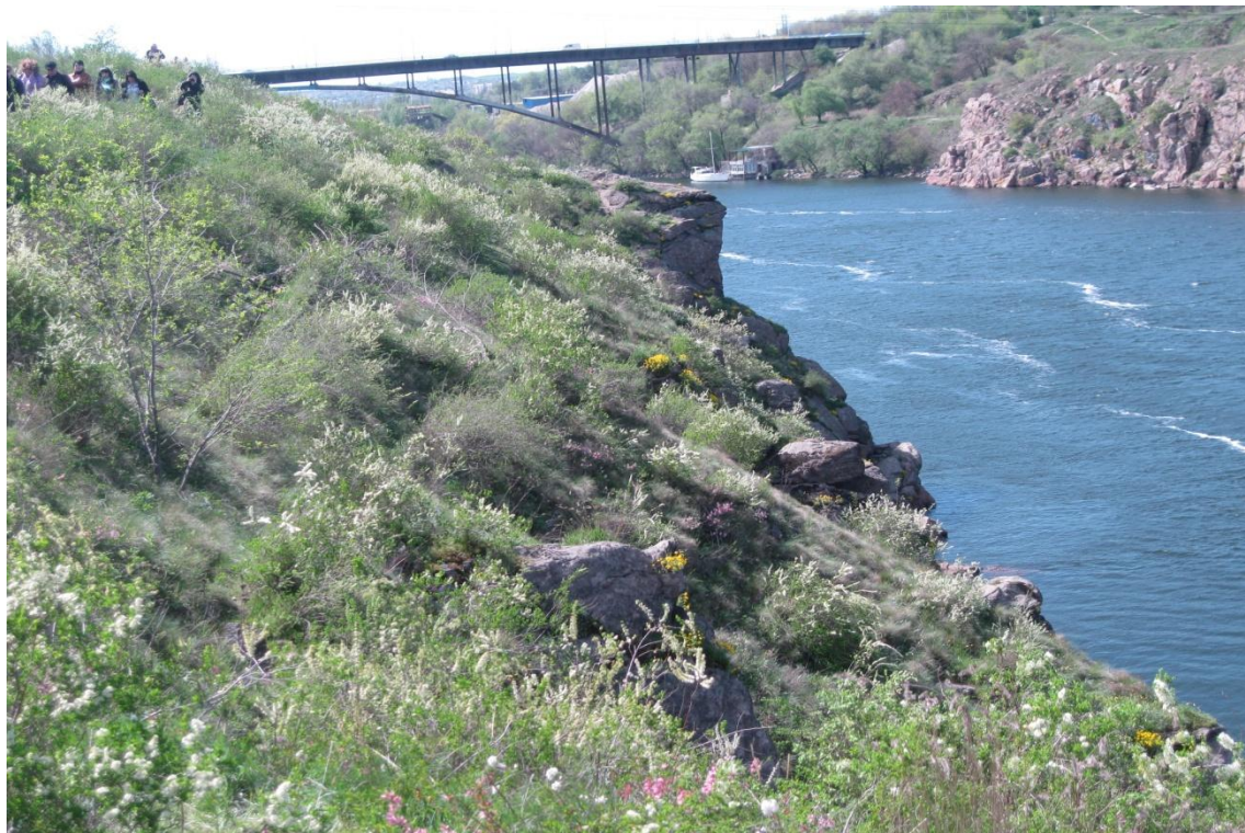
Мал. 2 Пішохідна екскурсія Північною частиною острова Хортиця.

Дещо складною була пішохідна екскурсія по північній частині острова Хортиця. Це було пов'язано з рельєфом даної місцевості (мал. 2). Необхідно мати зручне взуття під час екскурсії.