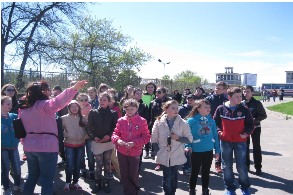
Мал. 15 Архітектура комплексу греблі Дніпрогесу