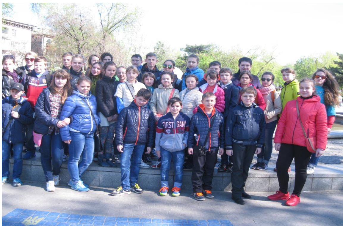
Мал. 8 Площа Маяковського