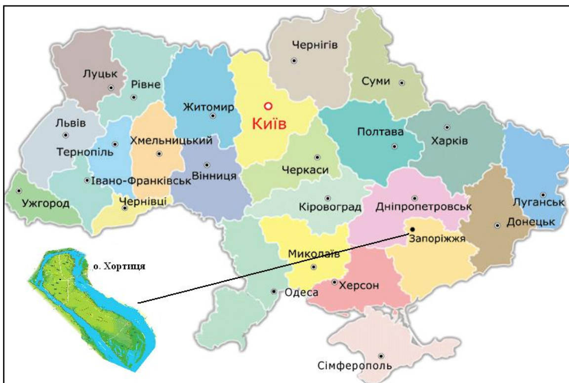
Мал. 3 Оглядова карта