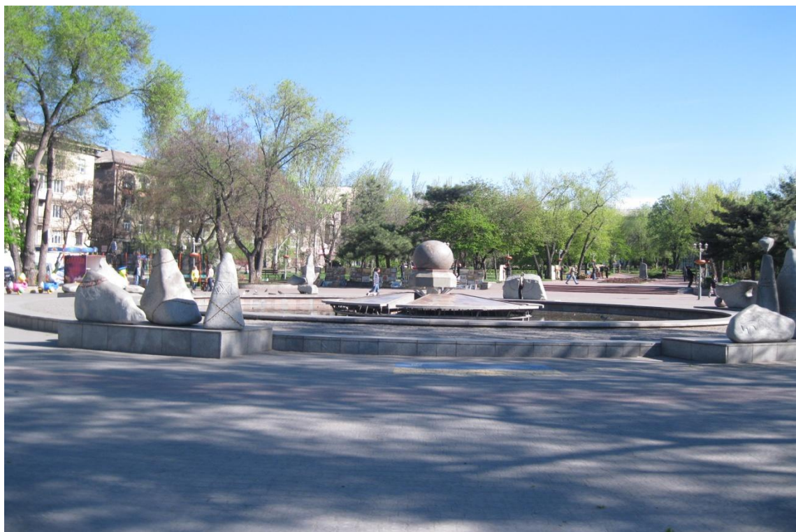
Мал. 7 Площа Маяковського

побудований на площі Маяковського у 1968 році, реконструйований у 2004 році, який присвячений учасникам ліквідації та жертвам Чорнобиля. Щорічно відкриття фонтану здійснюється 26 квітня — в день пам'яті жертв Чорнобиля.