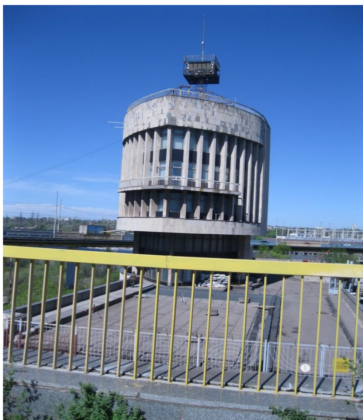
Мал. 14 Архітектура комплексу греблі Дніпрогесу