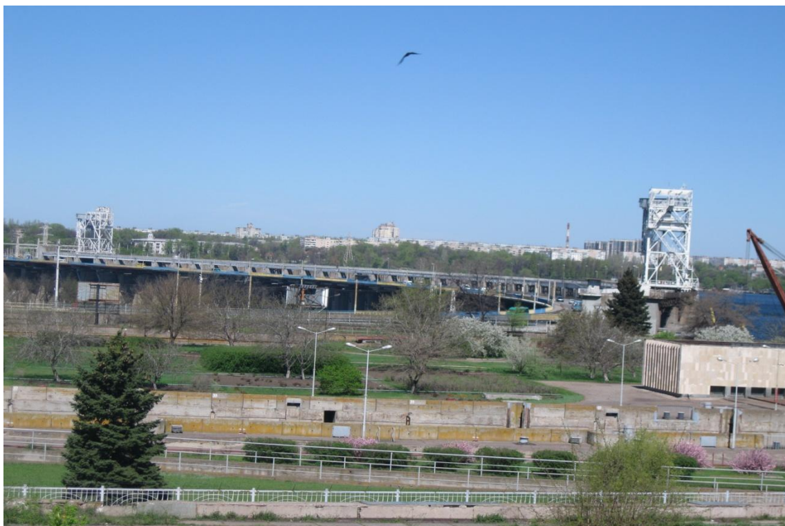
Мал. 16 «Дихаючий» місту біля ДніпроГЕСу.

Далі ми вирушили на острів Хортиця. Національний заповідник «Хортиця» — створений у 1965 році, а статус національного отримав б