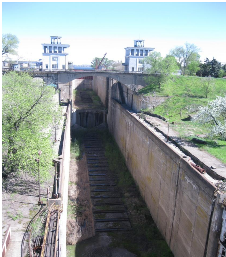
Мал. 13 Архітектура комплексу греблі Дніпрогесу