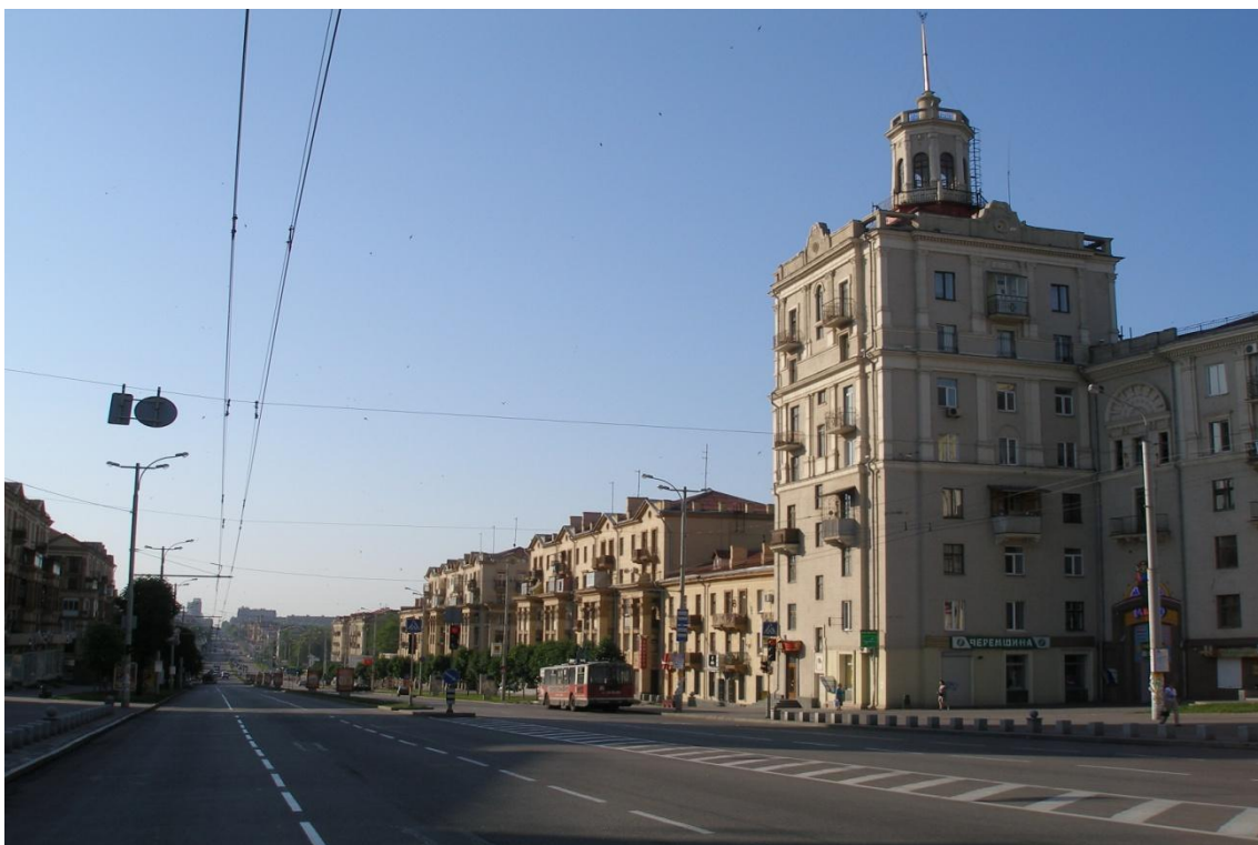
Мал. 5 Проспект Соборний

Почалася наша екскурсія містом Запоріжжя та його пам'яток. Автобусна екскурсія почалася з знайомства з промисловим підприємством: «Запорізький суднобудівельний завод» та «Запорізький металургійний завод», з архітектурними будівлями міста, проїхали «найдовшою вулицею у Європі» - проспект Соборний (мал. 5). Соборний проспект — центральна магістраль міста Запоріжжя. Простягається від Привокзальної площі біля вокзалу Запоріжжя І і закінчується площею Запорізькою поблизу Дніпровської ГЕС. Перетинає чотири міських райони — Комунарський, Олександрівський, Вознесенівський та Дніпровський. Протяжність проспекту становить — 10,8 км, завдяки чому розглядається як один із найдовших. Деякі джерела стверджують, що проспект є найдовшим в Європі. З 4 січня 1952 року до 19 лютого 2016 року проспект носив ім'я В. І. Леніна, після чого був перейменований у проспект Соборний.